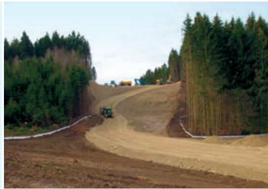
Grünbrücke - März 2016 Erdarbeiten