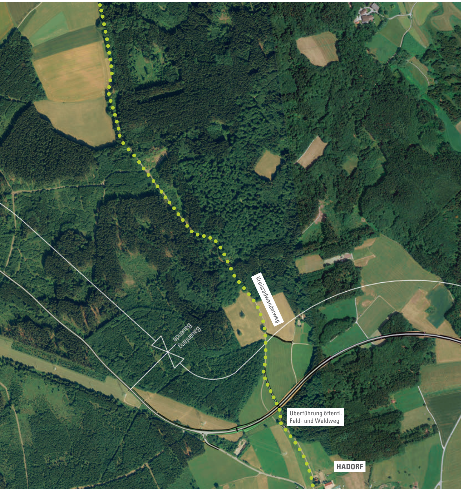
Grünbrücke - Oktober 2017 Wiederherstellung des Geländes