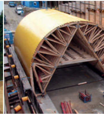
Grünbrücke - November 2016 Schalungswagen